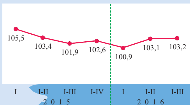
Dynamika a produkcji sprzedanej przemysłu b (ceny stałe c )