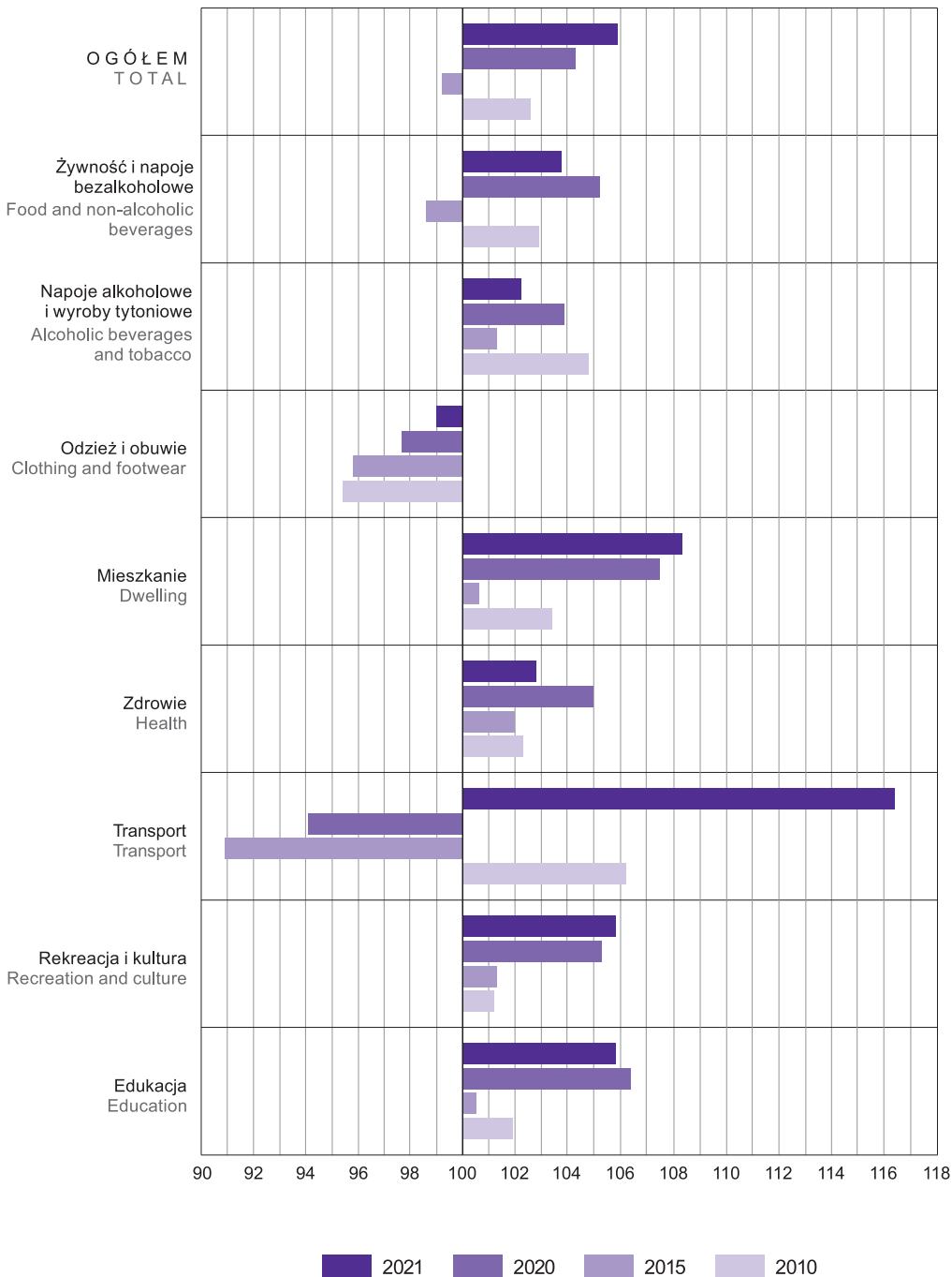
WYKRES 3 (77). WSKAŹNIKI CEN TOWARÓW I USŁUG KONSUMPCYJNYCH Rok poprzedni=100 CHART 3 (77). PRICE INDICES OF CONSUMER GOODS AND SERVICES Previous year=100